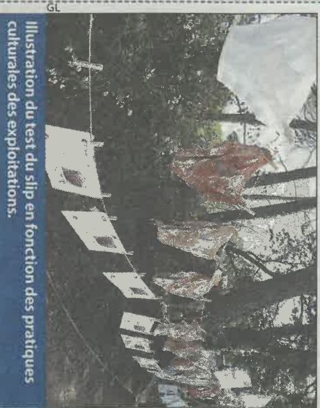
Illustration du test du slip en fonction des pratiques culturales des exploitations.

Cette année, les ingénieurs réseau Dephy ferme accompagnés par la Chambre d'agriculture du Var en maraîchage, oléiculture et viticulture ont expérimenté le test du slip sur les 32 exploitations engagées. 210 slips en coton, "bio de préférence", s'amuse la conseillère viticole Clémence Boutfol, ont ainsi été enterrés dans des parcelles conduites selon différentes pratiques, afin d'évaluer leur impact sur l'activité biologique. Entourés superficiellement à environ 15 cm dans le sol, pendant une durée de deux à trois mois entre avril et juillet, les slips ont ensuite été déterrés et comparés. L'activité biologique étant évaluée en fonction du niveau de dégradation du coton, mais aussi de l'odeur et de la couleur des slips. Les résultats observés ont notamment mis en évidence "une activité importante quand on apporte des amendements organiques. L'implantation d'engrais verts ou d'enherbements est aussi un facteur stimulant", indique Emilie Buron, responsable du réseau Dephy en maraîchage. Globalement, même cela semble plus flagrant en maraîchage qu'en viticulture ou en oléiculture, les apports de matière organique d'origine animale semblent renforcer cet effet.